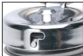
ピュアテイクポンプ