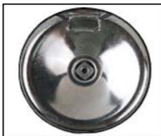
ワンタッチポンプ