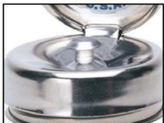
ピュアタッチポンプ