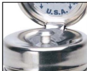
ピュアタッチポンプ