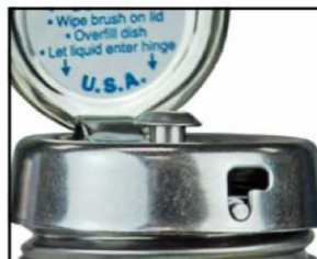
ピュアテイクポンプ