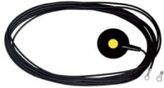
3040 静電アースコード