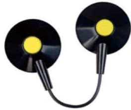
3043S 接続用静電アースコード