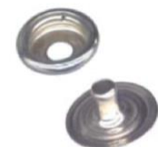
10mmスナップソケット

ソケットスナップは、アイレットの先端をスナップ取付用ツールでソケットの中心に圧着することで、マット上部のソケットとマット裏面のアイレットの間にマットを挟み込むことで所定の位置に保持できます。1セットにソケットとアイレットが10個ずつ含まれます。