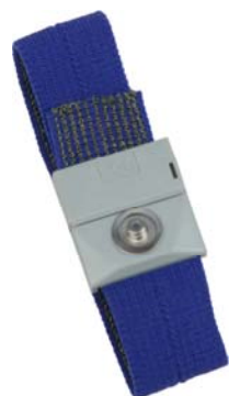
リストバンドカラー：青